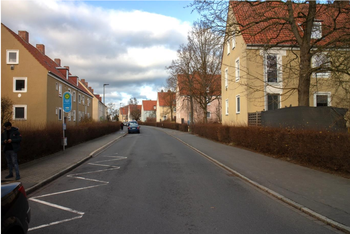
Straßenraum „Auf dem Hagen“