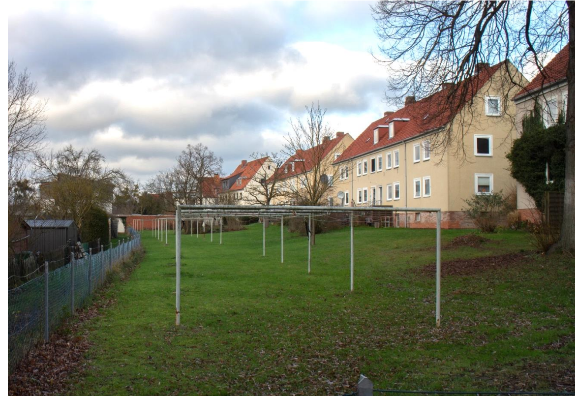
Rückwärtige Ansicht der Bestandsgebäude